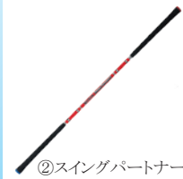
②スイングパートナー