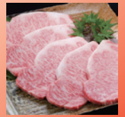
②鹿児島黒毛和牛 サロインステーキ6枚入り