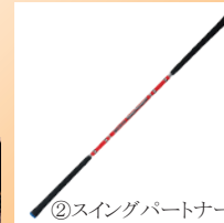
②スイングパートナー