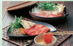
③鹿児島黒毛和牛 すき焼き肉