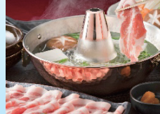
③福岡県産 ふくよか豚 しゃぶしゃぶ2種盛