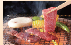
③鹿児島黒毛和牛 焼肉用