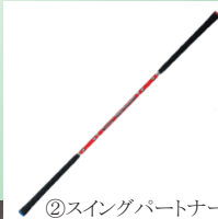
②スイングパートナー