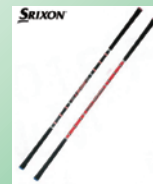
②スイングパートナー