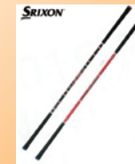
②スイングパートナー