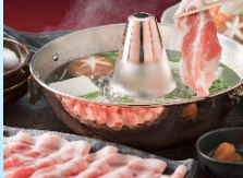
③福岡県産 ふくよか豚 しゃぶしゃぶ2種盛