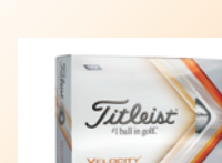
①オリジナルボール4ダース