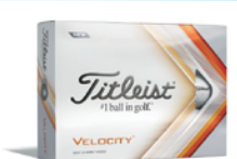
①オリジナルボール2ダース