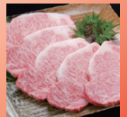
②鹿児島黒毛和牛 サーロインステーキ6枚入り 1枚 200g