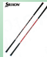
②スイングパートナー