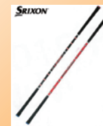
②スイングパートナー