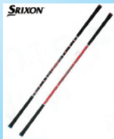
②スイングパートナー