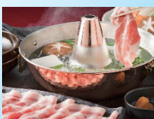
③福岡県産 ふくよか豚 しゃぶしゃぶ2種盛