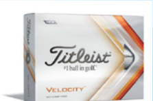
①オリジナルボール2ダース