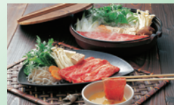
③鹿児島黒毛和牛 すき焼き肉