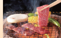
③鹿児島黒毛和牛 焼肉用