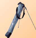
②TOUR B セルフスタンド