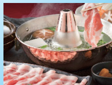
③福岡県産 ふくよか豚 しゃぶしゃぶ2種盛