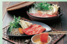
③博多和牛 すき焼き肉