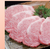
②伊万里牛 サーロインステーキ5枚入り