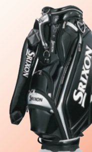
①スリクソンキャディバッグ