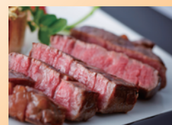
③鹿児島黒牛 サーロインステーキ3枚入り