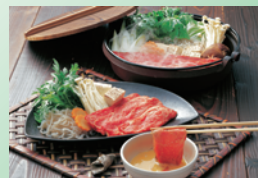
③博多和牛 すき焼き肉