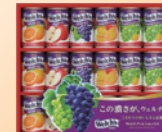
②ウェルチ ギフトセット 4セット