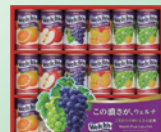
②ウェルチ ギフトセット 2セット