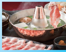
③福岡県産 ふくよか豚 しゃぶしゃぶ2種盛