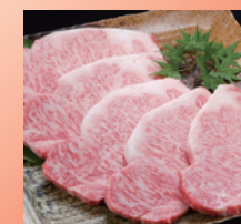
③伊万里牛 サーロインステーキ5枚入り